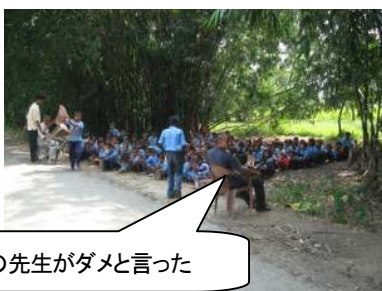
この先生がダメと言った

病院近所に新設された小学校です。小さな小さな学校です。家と家との空き地に作られ、校庭は凹みです。教室は校庭隅に盛り土をして建てられています。学校の写真を撮るな、と言われてありません。又、説明しているところも撮りませんでした。コソッと写真を撮りました。暑いので竹藪の日陰で衛生教育をしました。