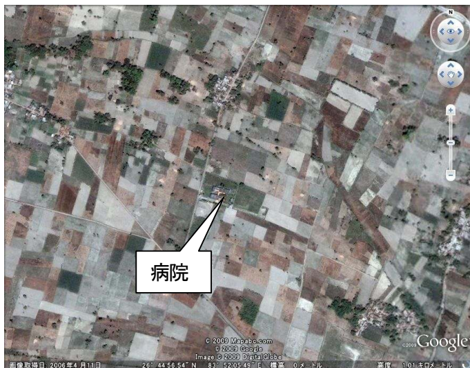
病院を中心とした周辺です。↑ 高度 1000m。

本当に畑の中にあります。サトウキビ栽培も盛んで、どこかで出会った風景で、そうそう沖縄です。