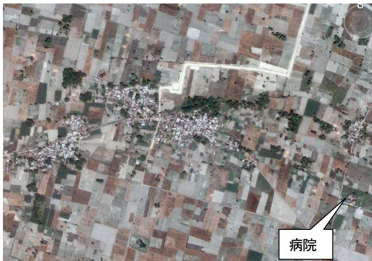
病院周辺の村です。

◎ 遊覧飛行に、ご招待です ◎ この「病院－クシナガル」コース 遊覧飛行は無料です。