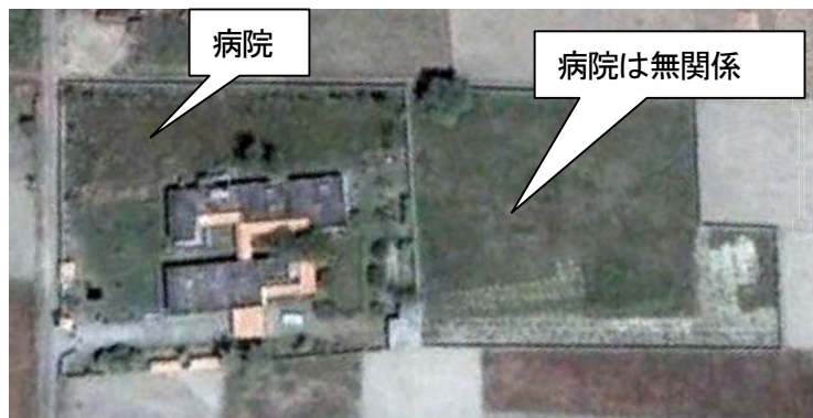
↑ 高度 180m です。

これから、ジャガイモ等の植え付けが始まります。40℃以上になる季節には植え付けをしないようです。