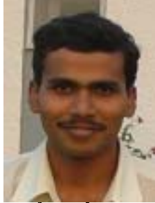
ギャンブラカシュ